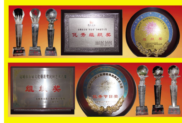
县文化馆荣获“优秀组织奖”、“组织奖”、“优秀节目奖”