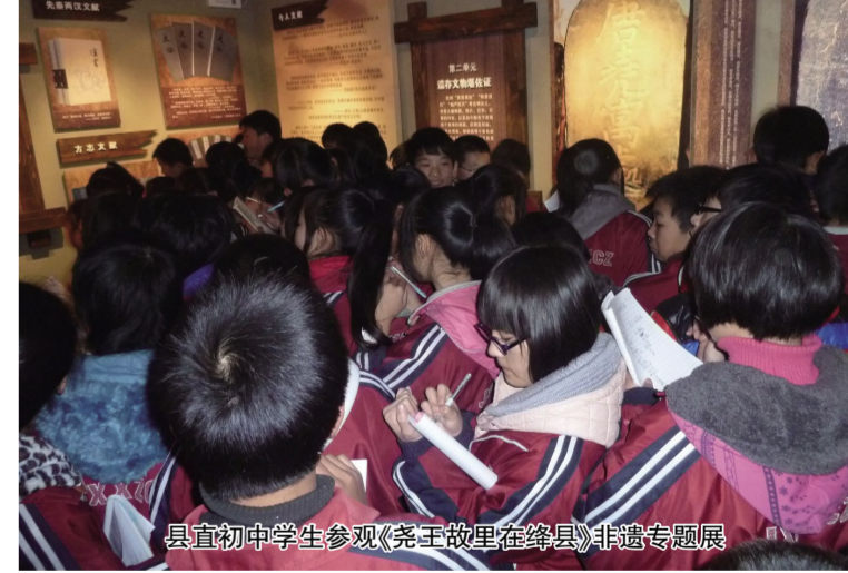
县宜初中学生参观《尧王故里在绛县》非遗专题展