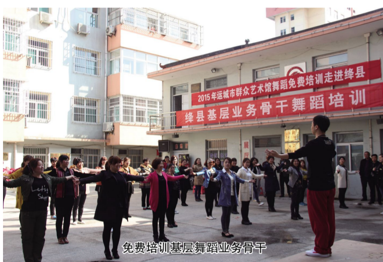
免费培训基层舞蹈业务骨干