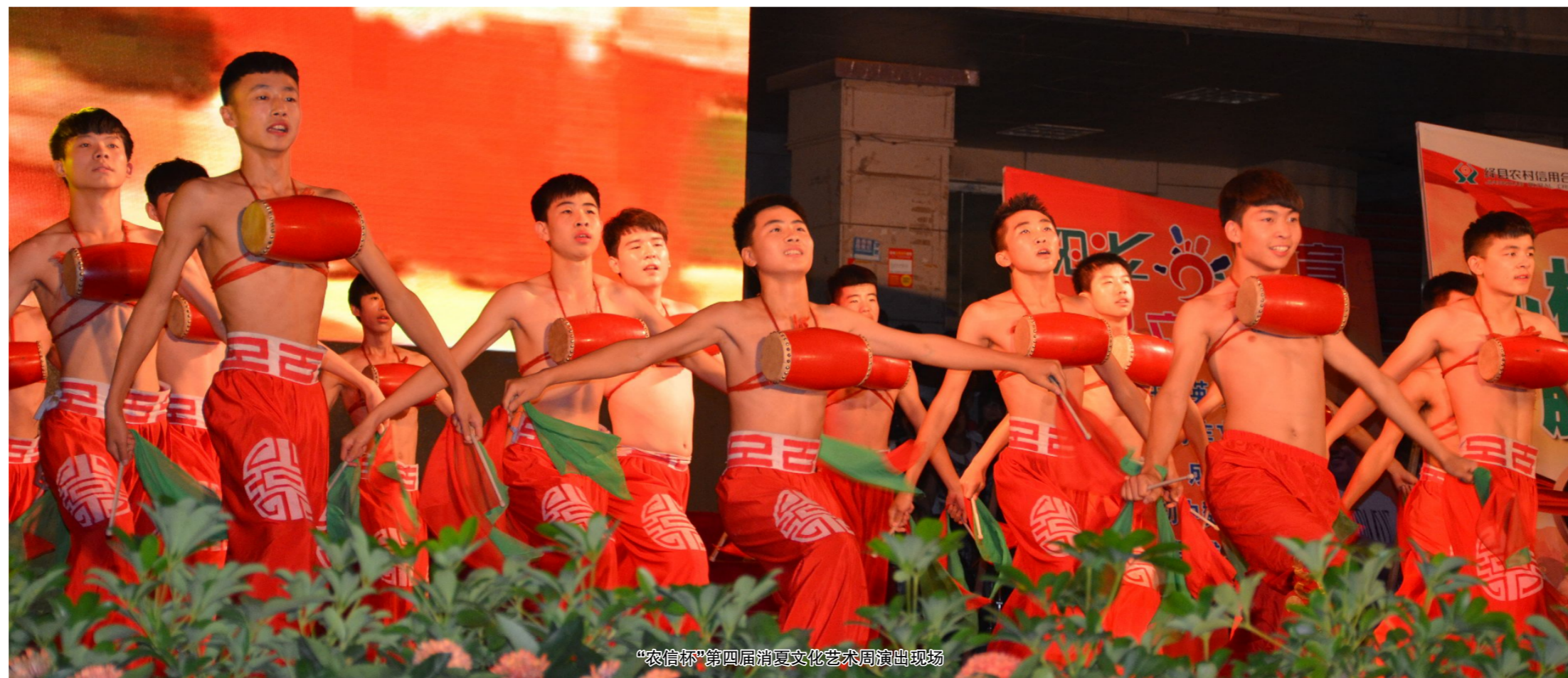
“农信杯”第四届消夏文化艺术周演出现场