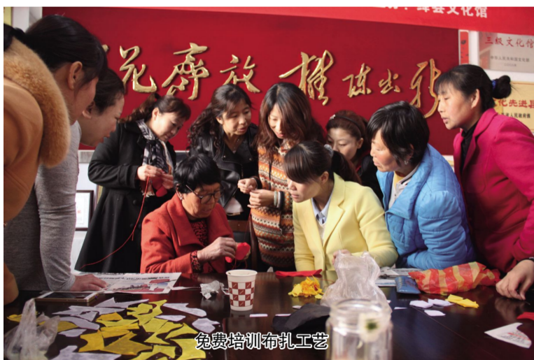
免费培训布艺工艺