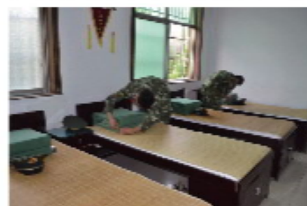
2 / 豆腐块似的被子是每个战士的必修课。整理内务、洗漱，紧张而有序。