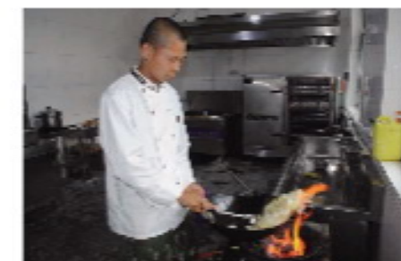
3 / 炊事班的战士在准备早餐。