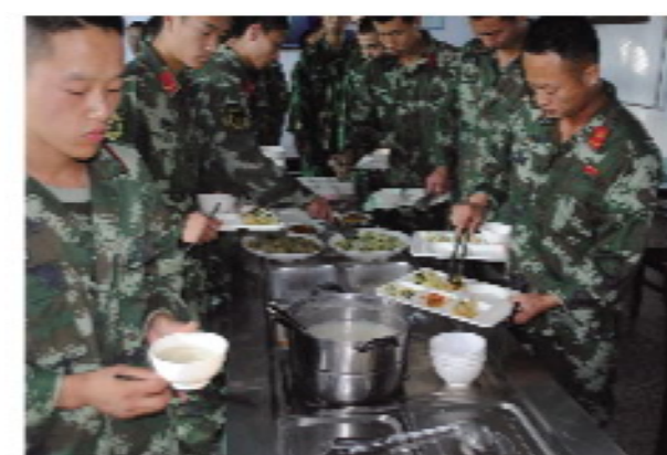
4 / 7:30早餐，战士们快速用餐后，开始上午的训练。