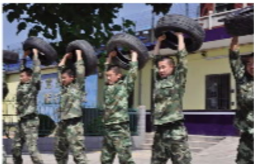
6 / 体能、队列……，一遍一遍地重复训练。体力的消耗加酷暑的高温，磨砺着战士们的意志。午餐后，除了巡查和哨位上的战士，他们有两个小时的午休。