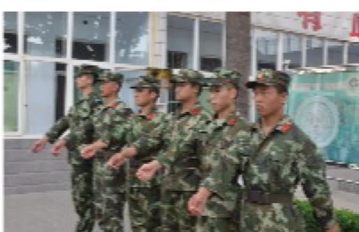
8 / 巡查。