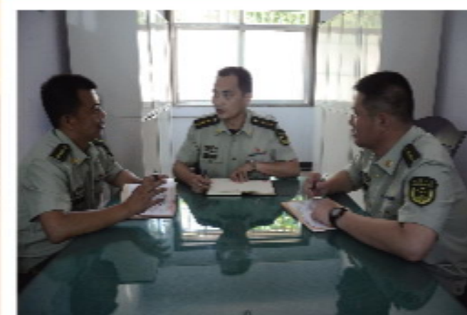
5 / 指导员、队长、排长在研究工作。