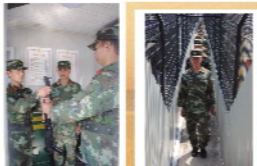
7 / 每隔两个小时，每隔两个小时的交接哨，庄重、严谨。