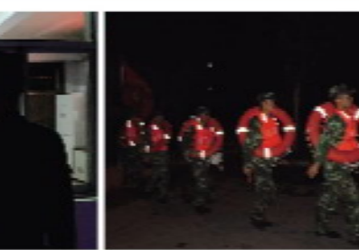
12 / 21:30熄灯，战士们就寝。一旦有紧急情况，无论几点，在紧急的集结号下，战士们迅速集合，穿上装备，出发……