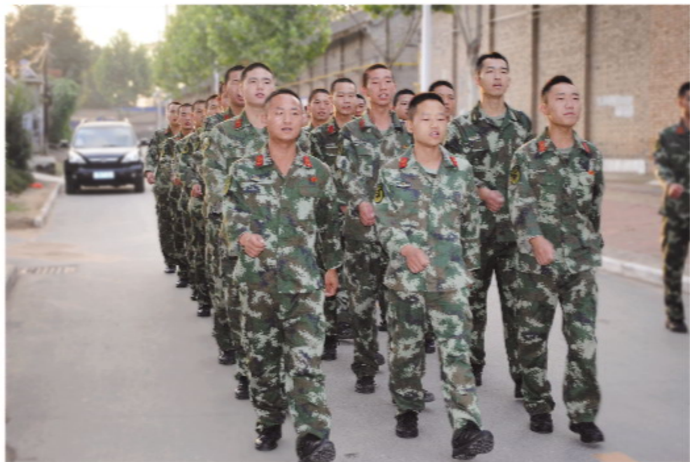
1 / 清晨6时，晨曦初露。随着起床号和一阵急促的集结号声，战士们起床、出操，开始了一天紧张的军营生活。每天晨操3—5公里的长跑，对于战士们来说已经是“家常便饭”。

八一前夕，记者走进驻绛武警中队，零距离接触战士们的训练和生活，感受武警战士的风采，去了解我们身边这些最可爱的人。