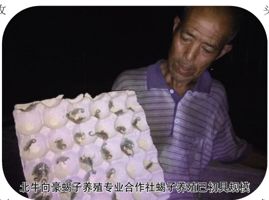
北牛向豪蝎子养殖专业合作社蝎子养殖已初具规模