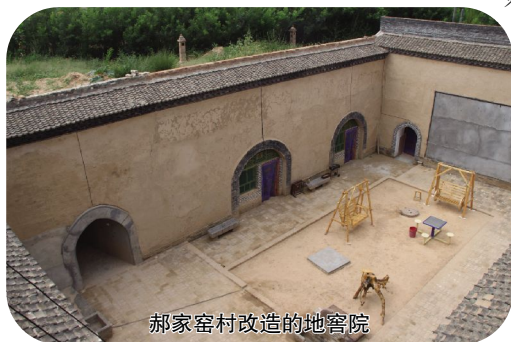
郝家窑村改造的地窖院

的山楂生产、加工、销售龙头企业。新建的隆立康公司占地125亩,总投资2.56亿元,利用现代生物技术向医药、养生保健品高端领域进军,研发生产的“华茸”鹿酒、鹿骨酒已投放市场,胶囊、口服液、针剂类等养生保健系列产品正在研发当中。