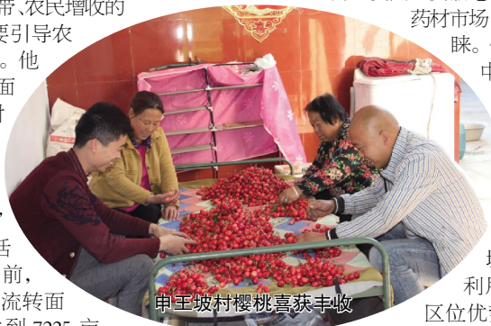
申王坡村樱桃喜获丰收