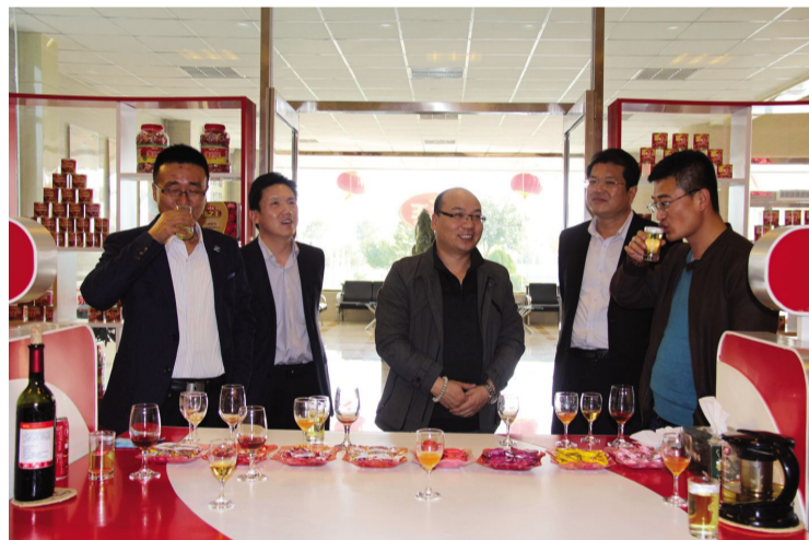
北大峡谷、东华山滑雪场、隆利康鹿士投资的“反哺工程”落户家乡。保健品项目等一批由绛籍在外人

今年,县招商引资局在传统全民招商、网上招商、节会招商等招商基础方式上,重点实施了由县级领导负责,相关部门参与的产业专业小分队招商、商会招商和微信招商等三种新的招商方式。一是实行产业专业小分队招商。根据我县“两乡、五区”发展定位和产业基础,今年重新调整了特色农产品加工、新型能源、机械制造转型、通航产业、文化旅游 5 个区域 10 个专业招商小分队。全县 10 支招商小分队外出招商 50 次,对接洽谈企业 33 家,签约项目 20 个。二是商会招商。积极参加太原、西安(绛县)商会的活动,利用乡情进行精准招商,凭借商会广阔的人脉资源和互利共赢的发展理念吸引更多的企业家来绛投资,目前,已有波音大酒店、绛