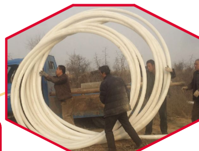
西乔葡萄种植园区施工如火如荼