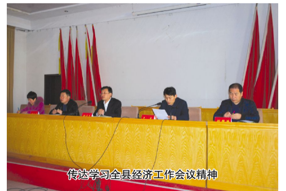
传达学习全县经济工作会议精神

务、供销基层组织与精准脱贫紧密结合起来,引导贫困群众参与农产品网上销售。大力培育产业龙头企业和专业合作组织,鼓励贫困对象通过“公司+合作社+农户”或利用承包地、精准扶贫贷款参股入股等方式分享经营收益,加快脱贫步伐。积极整合培训资源,对贫困群众进行技能培训,帮助贫困群众“拔穷根”。