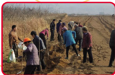
西吴村大樱桃地标基地项目建设顺利推进