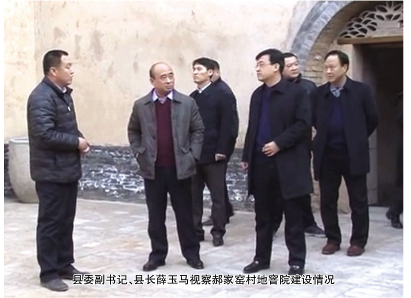
县委副书记、县长薛玉马视察郝家窑村地窑院建设情况

古绛镇是县治所在地,辖区面积 137.5 平方公里,下辖 53 个行政村、3 个社区居委会和 64 个党支部。古绛镇党委、政府把古绛的发展放在“两乡五区”大盘子中去思考,来定位,确立了“四个重点、六个园区”全年主要发展目标,四个重点即全力以赴地服务好、保障好县委、县政府主抓的五个棚户区、城中村改造、兰州光伏发电、“一场五馆”等四个重点项目;“六园区”即申王坡村大粒樱桃示范园区,北杨村山楂园艺管理示范园区,下高池村大棚蔬菜示范园区,西荆村 2000 亩光伏设施农业示范园