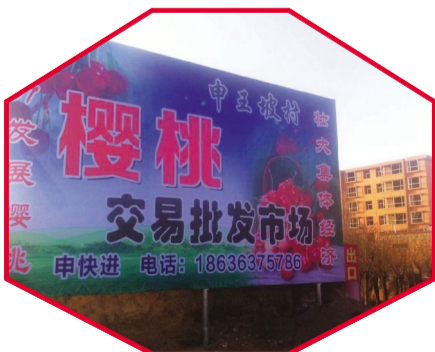
申王坡樱桃种植初具规模