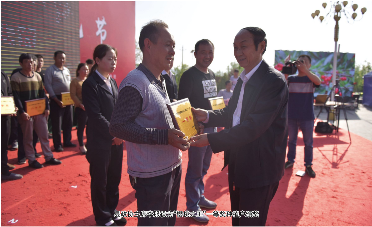
县政协主席李服役为“樱桃之王”一等奖种植户颁奖

4月28日,我县首届樱桃文化节举办“樱桃之王”评选活动,县政协主席李服役,县委常委、宣传部长解伟龙出席活动。