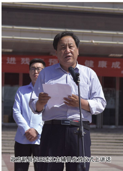
政府副县长王述江在辅具发放仪式上讲话

5月17日,县残联联合残工委成员单位法院、团委、妇联、司法局、交警队及县医院、红十字会医院、妇幼保健中心、各乡镇残联在电影院广场举行了隆重的“助残日”宣传,政府副县长王述江参加活动。活动现场,县残联为各乡镇部分持证残疾人发放辅助器具207件,不仅极大地改善了我县残疾人的生活状况,而且为他们更好地参与社会生活创造了条件。