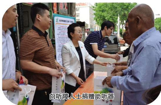
向听障人士捐赠助听器