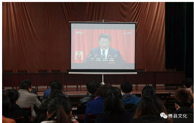
文化局干部职工收看十九大开幕会盛况直播