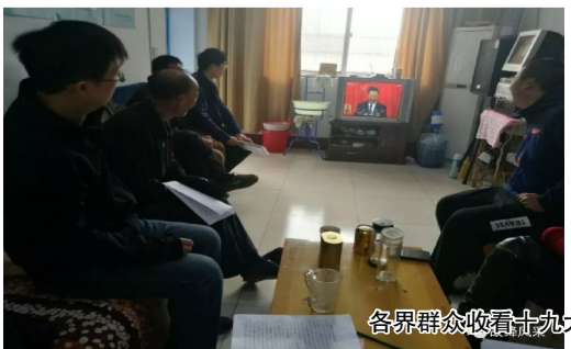
各界群众收看十九大开幕会盛况直播