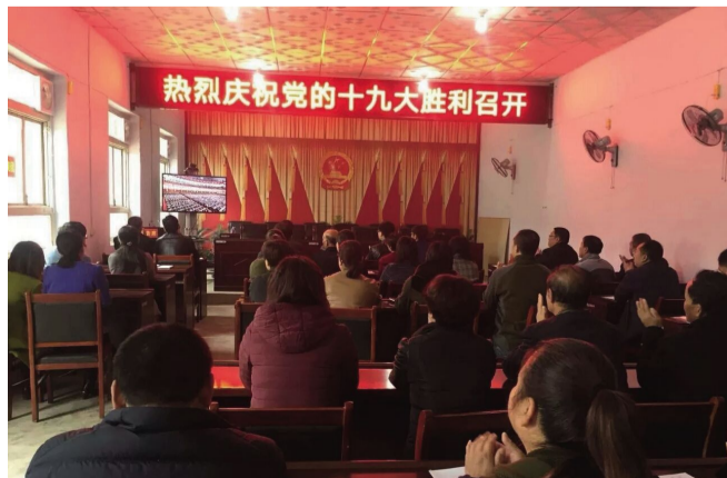
横水镇机关党员干部收看十九大开幕会盛况直播