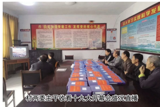
村两委干部收看十九大开幕会盛况直播