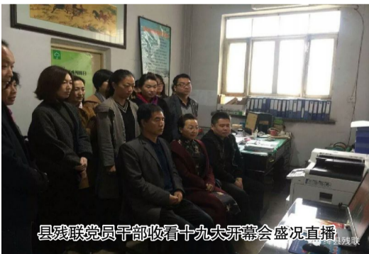
县残联党员干部收看十九大开幕会盛况直播