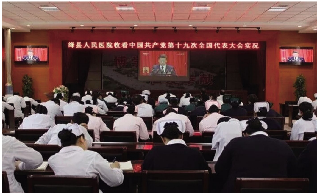
县医院干部职工收看十九大开幕会盛况直播