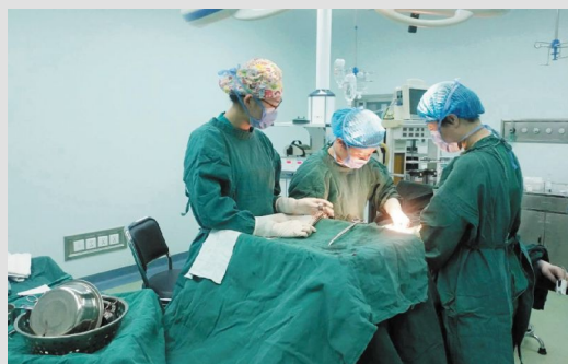
镜头五 正月初一 2:40

寂静的夜晚,手术室同时开展三台手术,在整个手术过程中,只能听到他们急促的话语声和器械的碰撞声。