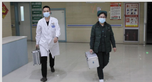
镜头六 正月初一 4:50

拯救生命、快速反应、分秒必争。绛县人民医院 120 急救中心的急救人员 24 小时守卫着急救生命的绿色通道,为人民群众的生命健康保驾护航。