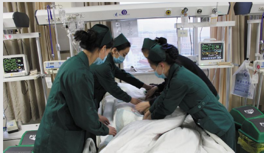
镜头三 大年三十 22:20

ICU 门外挤满了病人家属,几分钟前刚刚从住院部转上来三位重症患者。每一位夜班工作人员都在埋头工作。