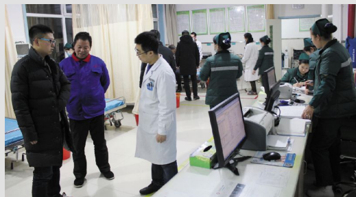
镜头四 大年三十 23:30

寂静的夜晚,手术室同时开展三台手术,在整个手术过程中,只能听到他们急促的话语声和器械的碰撞声。