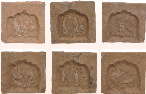
雕和线刻等。作风秀丽清新,细致生动。

绛县砖雕历史悠久,不少保留下来的明代、清代民居,都有砖雕装饰。当时有专门烧造方砖的窑。因砖料质坚而重,所以又叫“坚砖”。绛县砖雕,主要用来装饰建筑物的外观或内部。在厅堂前的门楼、照壁,以及墙的“墀头”与“裙肩”等部位,都有砖雕。内容多取材于戏曲故事、花鸟走兽、吉祥图案和书法等。技法应用透雕、浮